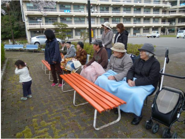
送迎バスから降りて まず、きれいな桜の花を観賞

お花見の日程を決めた頃は、桜が既に散ってしまっているのでは？と心配していましたが、今年は意外と花の蕾が長持ちし、当日はまだ6分咲き。絶好のお花見日となりました。