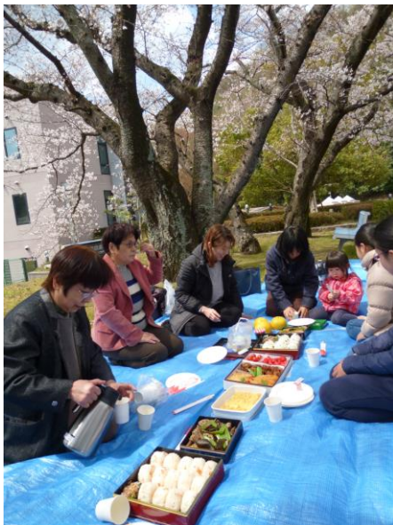
みんなを持ち寄った おいしいご馳走が、スラリ!

さらに今年は、仁伍町内会長さんも自転車で駆けつけて下さり、一緒にお花見弁当を囲みました。町内会長さんの参加で、一段と話がはずみました。NPO事務員もそれぞれ子連れの参加で、今年も多世代交流のイベントとなりました。また来年も開催できますように。