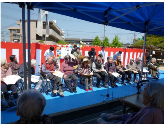
♪客席とステージの垣根を越えて、 皆で合唱♪